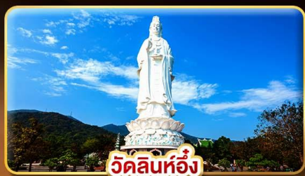
วัดลินห์ฮิ่ง

"พักบานาฮิลล์ 2 คืน" ไฟล์ทสวย "บินเช้ากลับตีง"