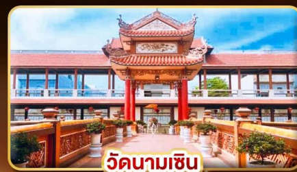
วัดนามเซิน