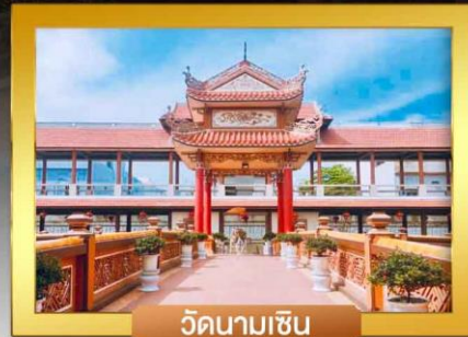
วัดนามเซิน